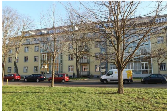
Foto 2: Straßensicht II